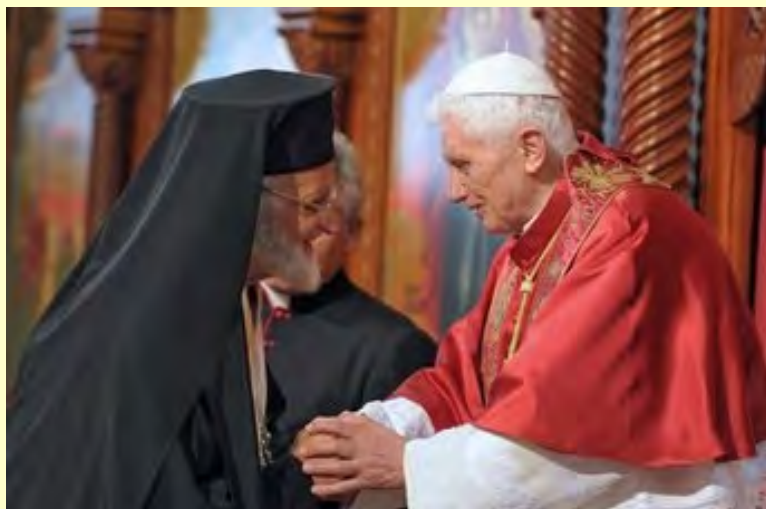
El patriarca de rito católico-melquita de Antioquía saluda al Papa en Beirut.

“... sed los mensajeros del evangelio de la vida, de los valores de la vida. Resistid con valentía a aquello que la niega: el aborto, la violencia, el rechazo y el desprecio del otro, la injusticia, la guerra. Así irradiaréis la paz en vuestro entorno” . “...Descubrid la verdad del perdón y la misericordia de Dios, que permite recomenzar siempre un nuevo día. No es fácil perdonar. Pero el perdón de Dios da la fuerza de la conversión y a la vez, el gozo de perdonar. El perdón y la reconciliación son caminos de paz y abren un futuro” .