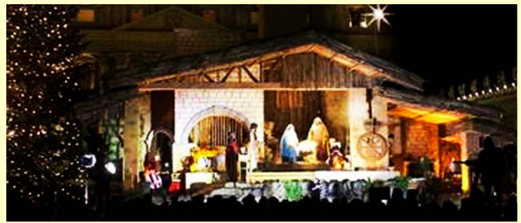
Un belén en la Plaza de San Pedro