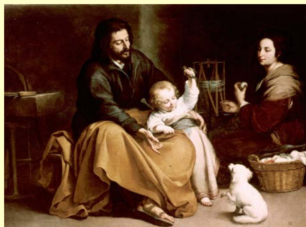
S. José en La Sagrada Familia del Pajarito, de Murillo

La puja se hará en el patio de los salones, si el tiempo lo permite. Si no fuera así se haría en el salón grande de arriba. Habrá un bar instalado con buenas tapas y bebidas.