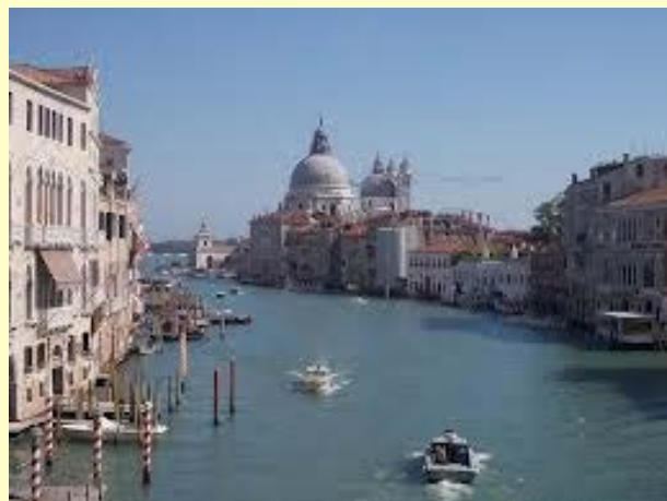
El Gran Canal de Venecia

IMPORTANTE: Las condiciones específicas pueden consultarse en Halcón Viajes, en la calle Colón, 3, o en el teléfono n.º 927 22 38 74.