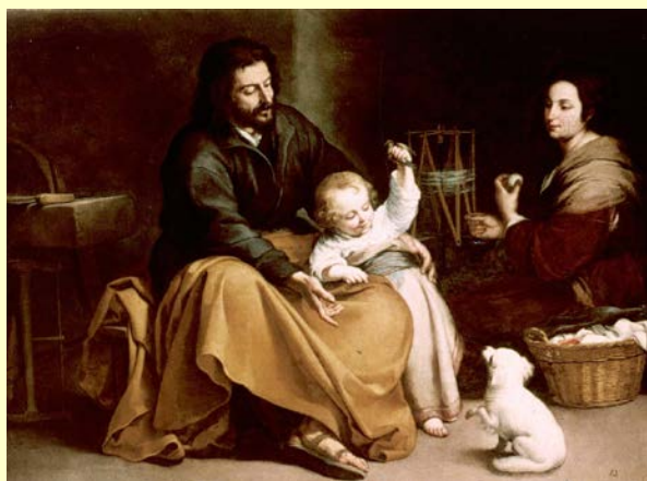
S. José en La Sagrada Familia del Pajarito, de Murillo

La puja se hará en el patio de los salones, si el tiempo lo permite. Si no fuera así se haría en el salón grande de arriba. Habrá un bar instalado con buenas tapas y bebidas.