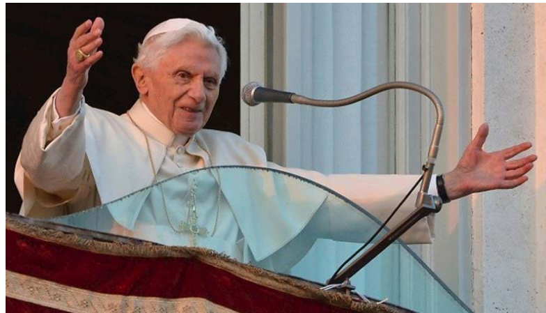
Una imagen para la historia: el adiós del Santo Padre desde Castelgandolfo

Por último, en los tres centros parroquiales estamos llevando a cabo mejoras en la instalación eléctrica, especialmente en el Templo Parroquial, que no cumplía las normas de seguridad, y en el C. P. Sagrado Corazón (Acacias). El coste superará en total los 8.500 €, por eso llamo a todos los fieles a hacer un esfuerzo más (sabemos que son muchos, para poder sufragar estas obras totalmente necesarias. Es un modo de poner en juego la limosna, poderosa arma de la cuaresma que nos ayuda en la lucha contra el pecado. Los párrocos sabemos que seréis generosos como siempre, contáis de antemano con nuestro agradecimiento.