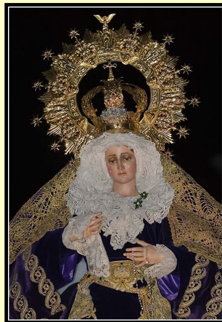
Imágenes que figuran en los desfiles procesionales de la Cofradía.