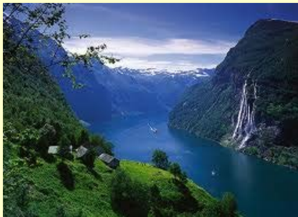
Bellísima vista de uno de los fiordos noruegos