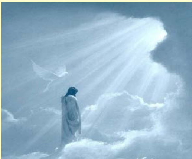
La Ascensión, una de las solemnidades de la Iglesia

En aquel tiempo dijo Jesús a sus discípulos: «Así estaba escrito: el Mesías padecerá, resucitará de entre los muertos al tercer día y en su nombre se predicará la conversión y el perdón de los pecados a todos los pueblos, comenzando por Jerusalén. Y vosotros sois testigos de esto. Yo os enviaré lo que mi Padre ha prometido; vosotros quedaos en la ciudad, hasta que os revistan de la fuerza de lo alto». Después los sacó hacia Betania, y levantando las manos, los bendijo. Y mientras los bendecía, se separó de ellos (subiendo hacia el cielo). Ellos se volvieron a Jerusalén con gran alegría y estaban siempre en el templo bendiciendo a Dios.