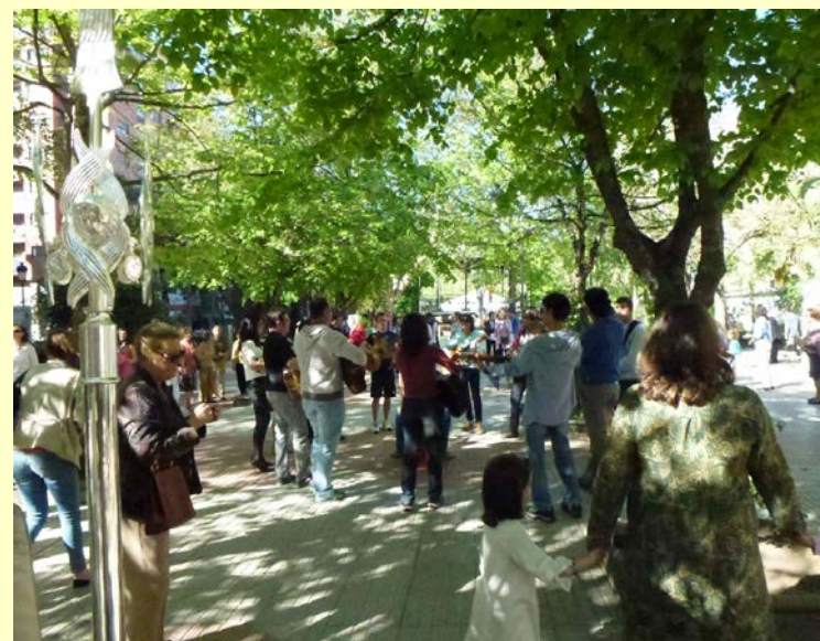
Imágenes de la "Gran Misión del Año de la Fe" en el paseo de Cánovas