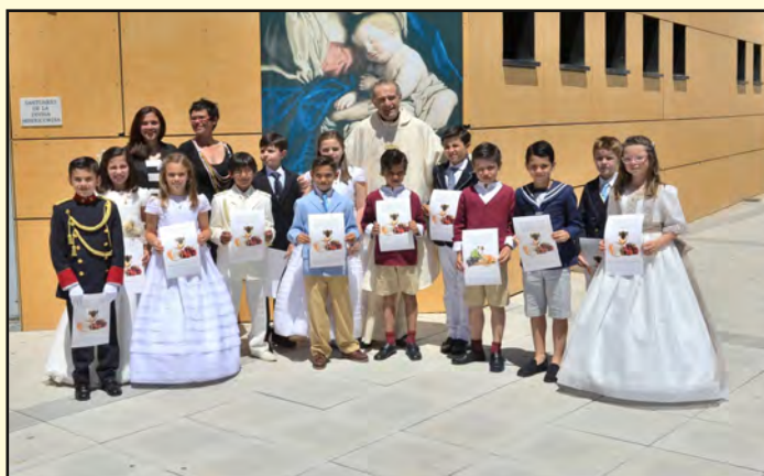
16 de mayo