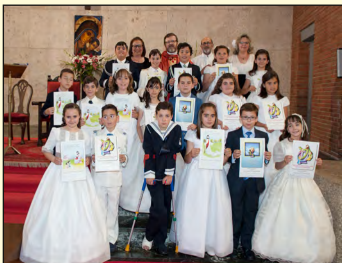
23 de mayo