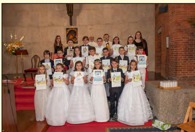
16 de mayo