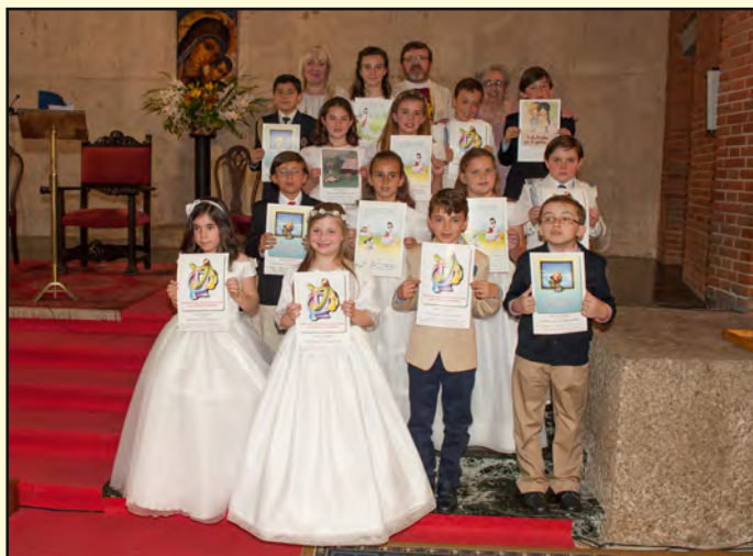
9 de mayo