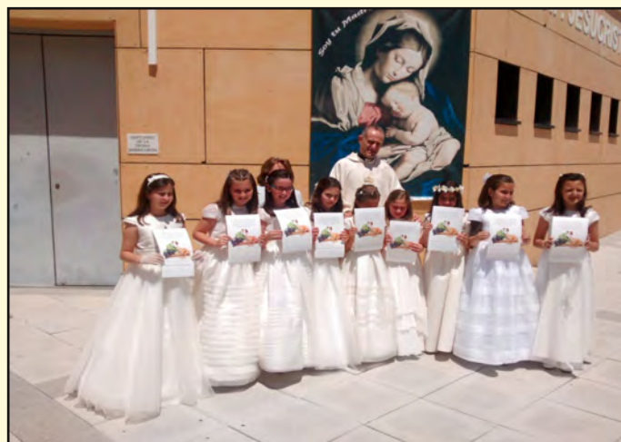
30 de mayo

¡FELICIDADES A TODOS LOS NIÑOS Y A SUS PADRES!