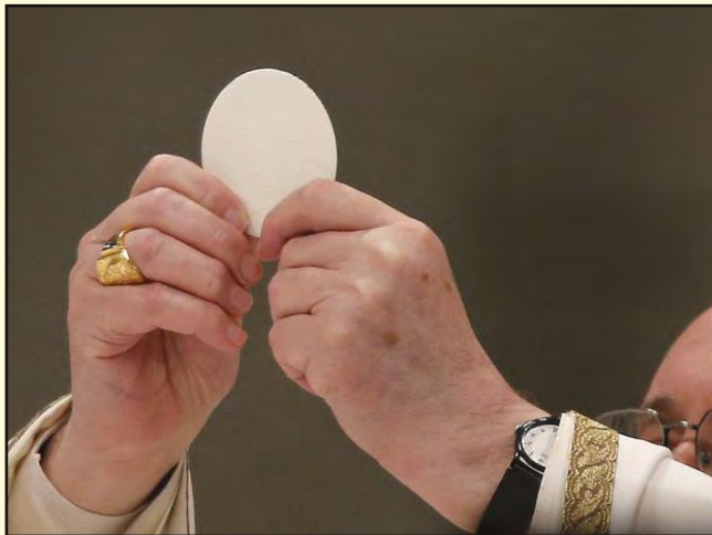
Papa Francisco en la consagración

El primer día de los ázimos, cuando se sacrificaba el cordero pascual, le dijeron a Jesús sus discípulos: «¿Dónde quieres que vayamos a prepararte la cena de Pascua?». Él envió a dos discípulos diciéndoles: «Id a la ciudad, encontraréis un hombre que lleva un cántaro de agua; seguidlo, y en la casa en que entre, decidle al dueño: “El maestro pregunta: ¿Dónde está la habitación en que voy a comer la Pascua con mis discípulos?”. Os enseñará una sala grande en el piso de arriba, arreglada con divanes. Preparadnos allí la cena». Los discípulos se marcharon, llegaron a la ciudad, encontraron lo que les había dicho y prepararon la cena de Pascua. Mientras comían, Jesús tomó un pan, pronunció la bendición, lo partió y se lo dio, diciendo: «Tomad, esto es mi cuerpo». Tomando una copa, pronunció la acción de gracias, se la dio y todos bebieron. Y les dijo: «Esta es mi sangre, sangre de la alianza, derramada por todos. Os aseguro que no volveré a beber del fruto de la vid hasta el día que beba el vino nuevo en el Reino de Dios». Después de cantar el salmo, salieron para el Monte de los Olivos.