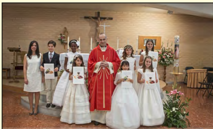
23 de mayo