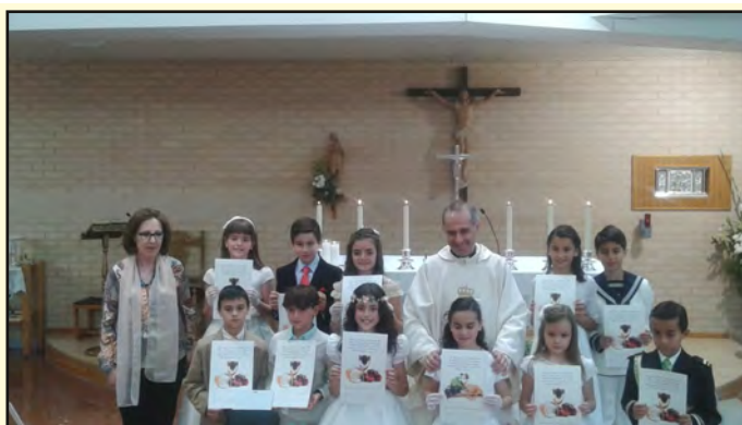
9 de mayo

En los dos templos en los que se han celebrado las primeras comuniones han tomado el cuerpo de Cristo por primera vez 90 niños. En la columna de la izquierda, las imágenes del Templo parroquial. A la derecha las correspondiente al C.P. Jesucristo Resucitado.