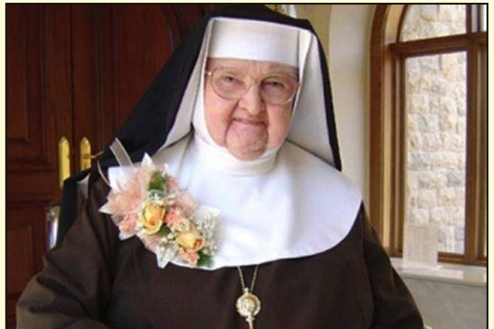
La madre Angélica el día de su 90 cumpleaños

Día 27, miércoles, Santo Rosario, a las 9:25 horas, desde la Concatedral de Sta. María de Cáceres.