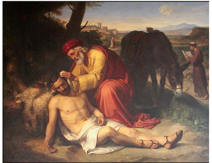
La parábola del buen samaritano, uno de los más bellos ejemplos de obras de misericordia

importantes, todas signos de amor que acompañan al anuncio del evangelio. Las corporales son: dar de comer al hambriento, dar de beber al sediento, vestir al desnudo, visitar a los enfermos, ayudar al preso, dar posada al peregrino y sepultar a los muertos. Las espirituales son: enseñar al que no sabe, dar buen consejo al que lo necesita, corregir al que se equivoca, perdonar las injurias, consolar al afligido, tolerar los defectos del prójimo y orar por los vivos y por los difuntos. Son toda una escuela de amor y testimonio de la presencia de Cristo. Evangelicemos esta Pascua con obras y palabras.