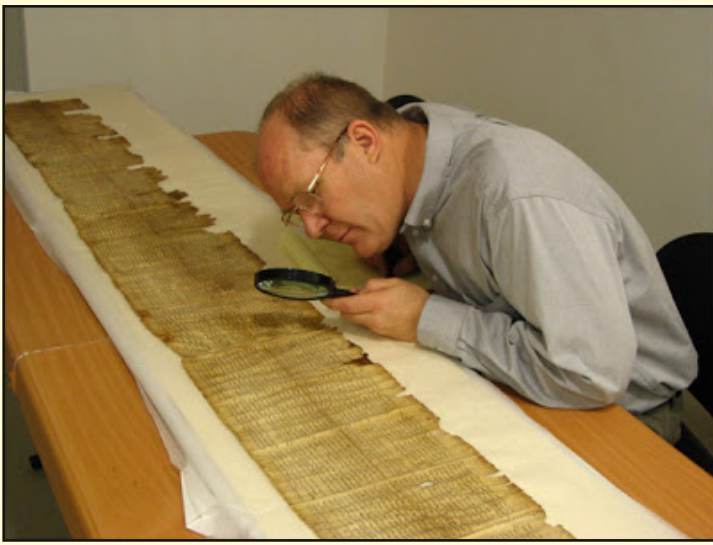
Un experto examinando algunos de los manuscritos del Mar Muerto.

En el próximo número, Dios mediante, publicaremos la segunda y última parte de este artículo. Queda para entonces una mención explicativa de los Biblias hebrea, griega y latina y de la labor meritoria y difícil de los copistas, de las variantes textuales y algunos aspectos de interés.